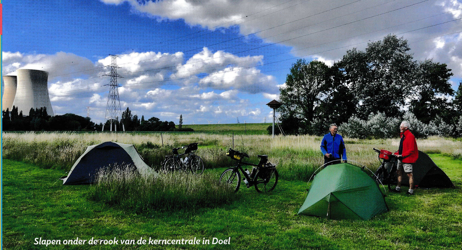
Slapen onder de rook van de kerncentrale in Doel

ming: een camping in het Brabantse Mierlo. Tegen een storm, kracht 7 soms 8 in, zwoegden we de volgende dag door het Brabantse land. Bij Fort Liefkenshoek staken we met een watertaxi de Schelde over, om uit te komen bij de enige camping in de verre omtrek: die van het spookdorpje Doel, onder de rook van een kerncentrale.